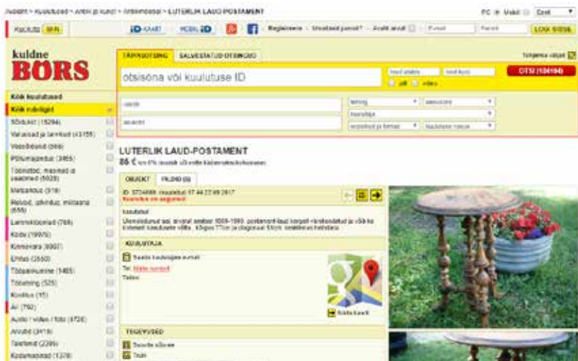
Pilt 1. Näide keele sekulariseerumisest. „Luterlik laud-postament“ (ekraanitõmmis 19.04.2017) – 20. sajandi esimeses pooles Tallinnas Lutheri vineerivabrikus toodetud mööbliese. On selge, et kuulutaja jaoks on sõna „luterlik“ religioosne tähendus võõras.

Kõige ekstreemsem näide pärinebki kiriklike kombetalituste kaasajastamise küsimusest. Kui palusin intervjueeritaval (N, 23) oma vastust põhjendada, saabus vestlusesse pikem paus. Püüdes vestlust edasi aidata, uurisin, kuidas intervjueeritav seda küsimust mõistab, millele vastati omakorda küsimusega: “Kombetalitus ( sic! ), see ei ole ju see, et mul on kodus lühter, mis on kas küünaldega või elektriga?” Kui palusin täpsustada, siis selgitas vastaja, et tal tekkis seos sõnaga “kaasajastada”, sest “elekter on ju kaasaegne...” ning ka ülejäänud intervjuu jooksul viitas ta moderniseerumisele (positiivselt) eelkõige elektriga seoses. See esmapilgul veidrana näiv vastus jäi mind mitmeks päevaks kummitama, kuni viimaks taipasin, et tegu on fenomeniga, mida olen nimetanud “keele sekulariseerumiseks”